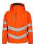
...101 Hi-vis Orange/ Grün