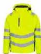
...3820 Hi-vis Gelb/ Schwarz