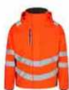
...1079 Hi-vis Orange/ Anthrazit Grau