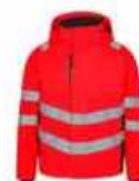
...4720 Hi-vis Rot/ Schwarz