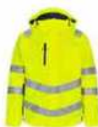
...38165 Hi-vis Gelb/ Blue Ink