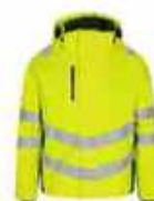
...381 Hi-vis Gelb/ Grün