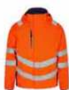
...10165 Hi-vis Orange/ Ink