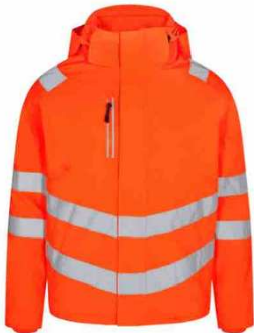
...10 Hi-vis Orange