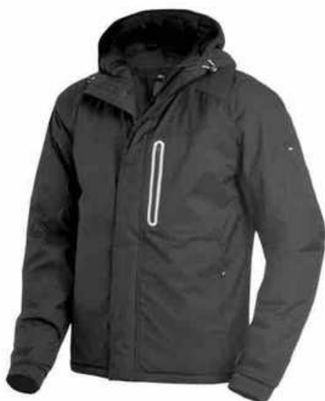
... 20 schwarz