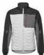
...30179 Weiss/ Anthrazit