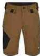
...41 Toffee Brown