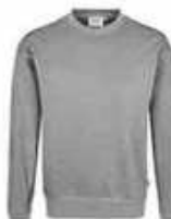
...15 Grau meliert