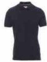
...08007 Marine blau