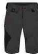
...79 Anthrazit Grau