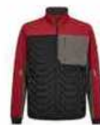
...7921 Anthrazit Grau/ Flame