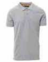
...13001 Grau meliert