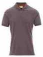
...13007 Rauch grau