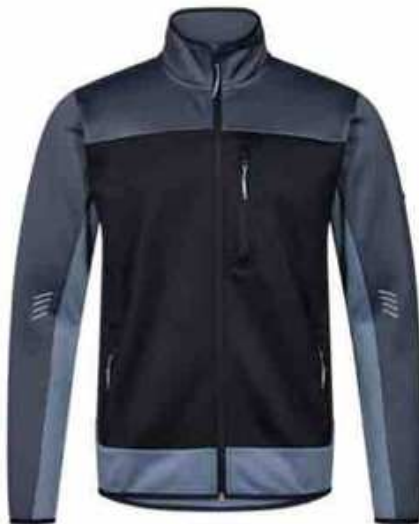
...50270 Deep Blue/ Dark Sea