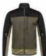
...5320 Forest Green/ Schwarz