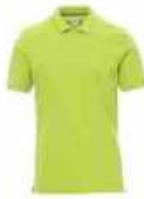
...07007 Sauer grün