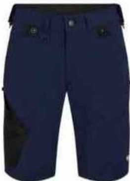
...165 Blue Ink