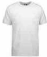
...200 Hellgrau meliert