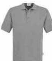
...15 Grau meliert