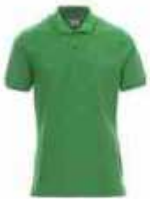
...07003 Gelee grün