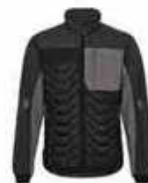
...7920 Anthrazit/ Schwarz