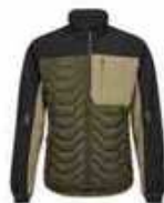
...5320 Forest Green/ Schwarz