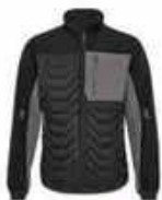
...2079 Schwarz/ Anthrazit