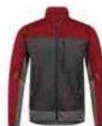
...7921 Anthracite Grey/ Flame