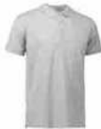
...210 Grau meliert