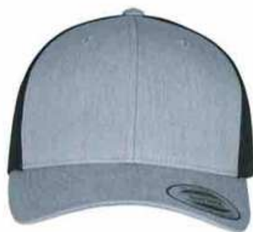
...R41 Heather Grey/Black