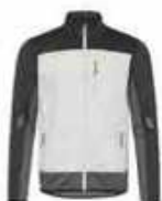
...30179 Weiss/ Anthrazit