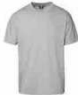
...210 Grau meliert