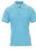
...09001 Atoll blau