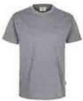
...15 Grau meliert