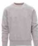
...13001 Grau meliert