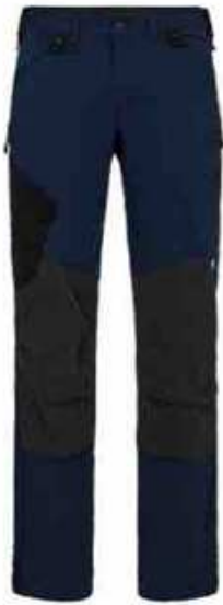
...165 Blue Ink