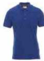
...09000 Königs blau