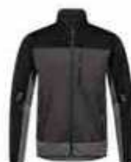
...7920 Anthrazit/ Schwarz