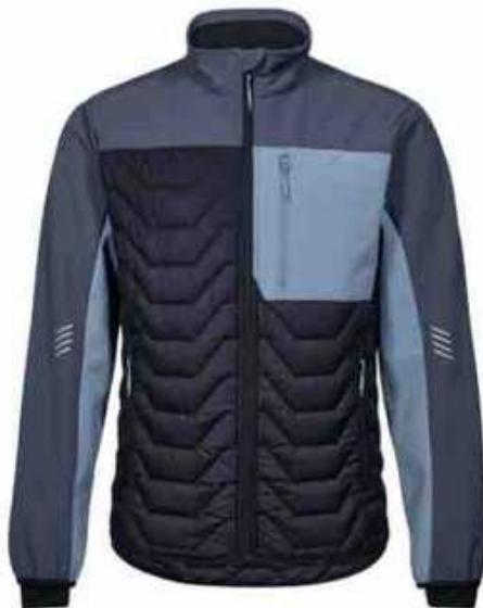
...50270 Deep Blue/ Dark Sea