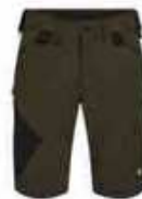
...53 Forest Green