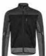
...2079 Schwarz/ Anthrazit